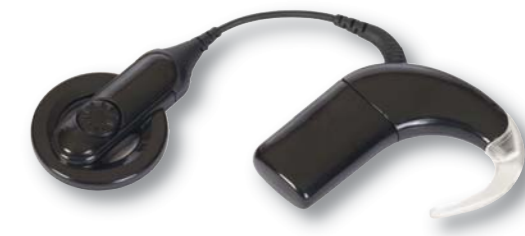
Die Invalidenversicherung kann auch Hilfsmittel wie Hörgeräte finanzieren.

L'assurance-invalidité peut aussi financer certains moyens auxiliaires comme les appareils auditifs.