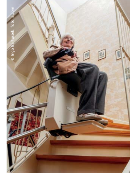
Ein Treppenlift kann den Alltag erleichtern und sicherer machen.

De nombreuses aides et améliorations ne nécessitent que peu ou pas d'investissement. Ranger les appareils et les aliments les plus utilisés aux endroits les mieux accessibles de la cuisine ne «coûte» par exemple que l'aide d'un proche. Un lit trop bas peut généralement être rehaussé par des moyens simples; ainsi, il redevient plus facile de se lever. A l'autre bout de la plage de coûts, on trouve le remplacement de la baignoire par une douche à l'italienne ou l'installation d'un monte-escalier, deux mesures qui se chiffrent en milliers de francs. Malheureusement, les personnes âgées doivent généralement supporter elles-mêmes les frais d'aménagement de leur logement. Il y a néanmoins la possibilité de demander une aide financière auprès de la Ligue contre le rhumatisme, de Pro Senectute ou de diverses fondations. Si insatisfaisante que soit cette réalité, il ne faut jamais perdre de vue le fait que notre santé et notre sécurité n'ont pas de prix et qu'un déménagement dans un autre logement ou un centre gériatrique est également très onéreux. ■