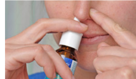
Utilisation d'un spray nasal