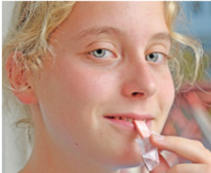
Mâcher du chewing-gum