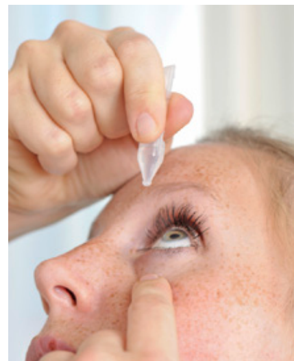
Administration d'un collyre