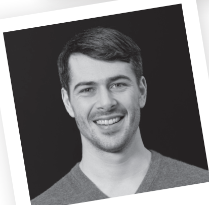
Raphael Diaz Eishockeyspieler