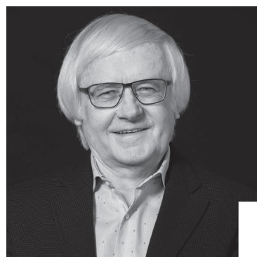
Gilbert Gress Fussballlegende