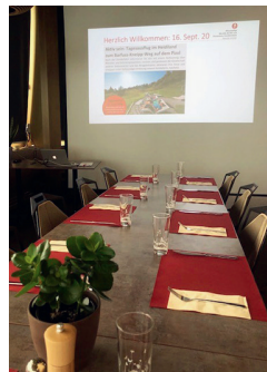
Tagesanlass «Barfussweg Pardiell, Pizol»