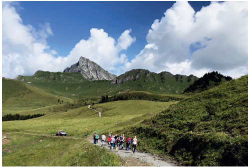
Tagesanlass «Hoch hinaus mit der Älplibahn, Malans»