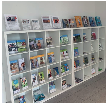
Neuer Standort Geschäftsstelle, Bahnhofstrasse 15, Bad Ragaz