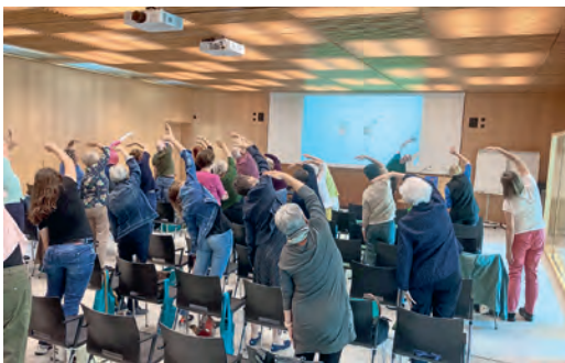
Gesundheitstage Fach- und Arztreferate, St. Gallen und Chur