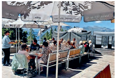
Ausflug ins Clinicum Alpinum, Fachvortrag, gesunder Lunch und Bewegungsprogramm Triesenberg/FL