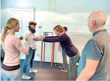
Weiterbildung Kursleitende, Bad Ragaz