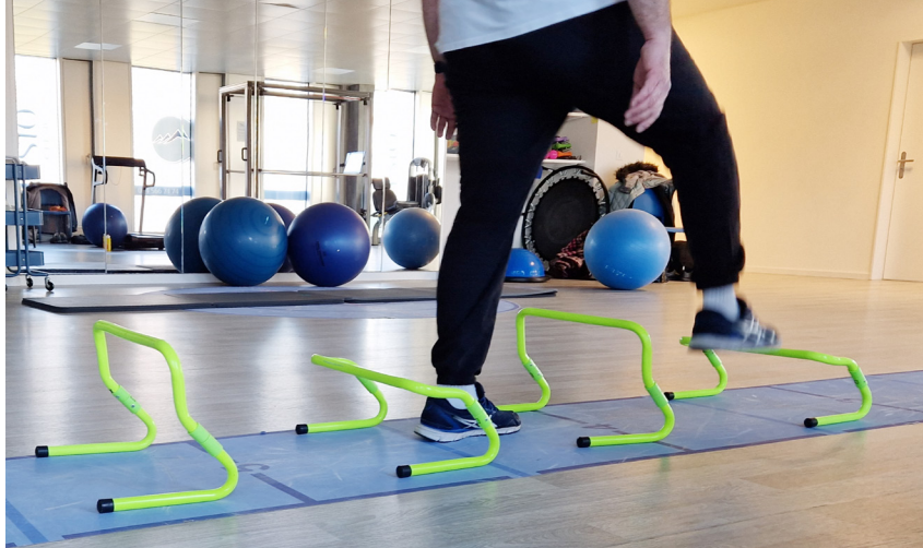
Exercices d'équilibre lors du cours Active Backademy de Montagny-près-Yverdon