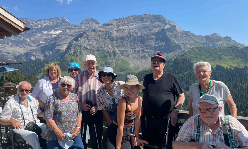
Séjour médico-social adapté 2022 – Les Diablerets