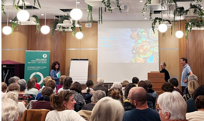
C'est l'Hôtel Alpha Palmiers à Lausanne qui a accueilli notre conférence sur l'alimentation.