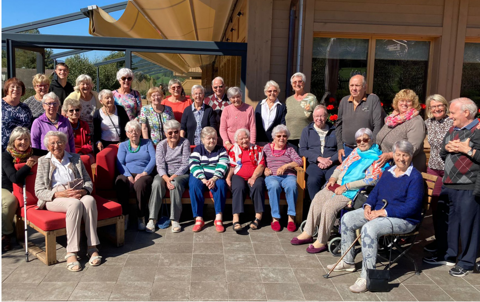
Photographie de groupe du séjour médico-social adapté de Saanen, édition 2022

P.S. Toutes les personnes illustrées dans ce document y ont consenti. Nous les remercions du fond du cœur de partager par l'image leurs expériences de nos prestations.