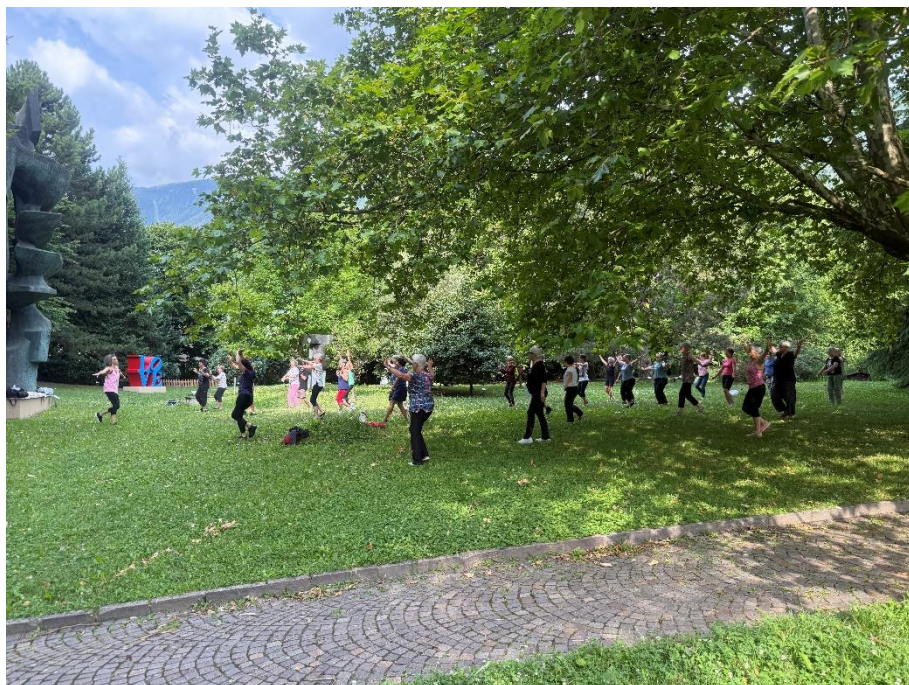
ZumbaGold, été 2025, Parc Fondation Gianadda à Martigny