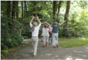
Gesund durch Bewegung

In das Tagungsprogramm sind immer Bewegungsangebote integriert. Genügend Bewegung ist ein wichtiger Schlüssel bei der Bewältigung von Rheuma und Schmerzen.